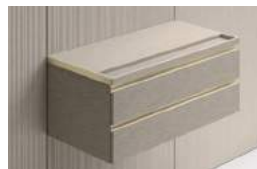
Coperchio con svuotatasche / Top with Coin Tray