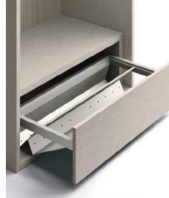
Cassetto Portascarpe H 288 / Shoe Drawer H 288