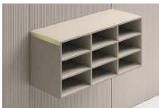
Moduli H 144 / Modules H 144