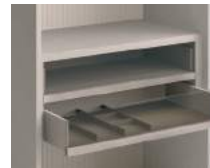
Cassetti con tappetino e separatori / Drawers with mat and partition