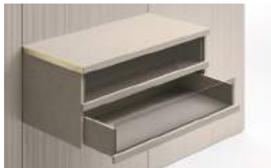
Cassetti tipo C con frontale vetro / Type C Drawer with glass front