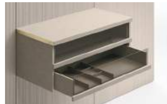
Cassetti con tappetino e separatori / Drawers with mat and dividers