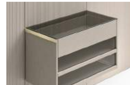
Top in vetro / Glass Top