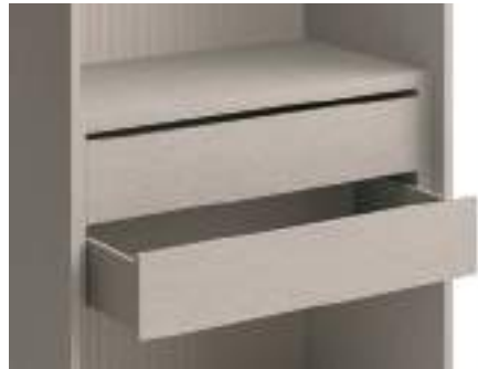
Cassetti tipo A con apertura / Type A Drawer with opening