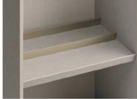
Ripiano portascarpe inclinato con doppio battitacco – P 535 / Inclined Shelf with Front Trim D 535