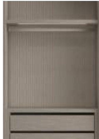
Sketch Roccia con schienali rigati / Sketch Roccia with fluted back panels