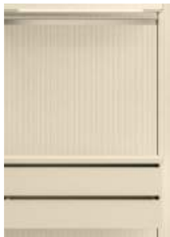
Sketch Sabbia anche con schienali rigati / Sketch Sabbia also with fluted back panels