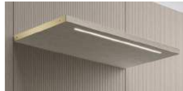
Led su ripiano / Led on shelf