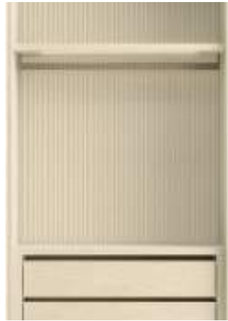
Sketch Sabbia con schienali rigati / Sketch Sabbia with fluted back panels