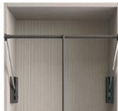
Servetto / Servetto Valet