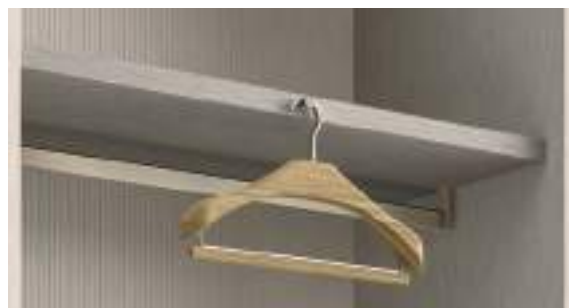
Perno estraibile / Pull-Out Hanger