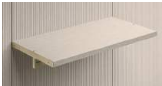
Ripiani Legno P 375/510 / Wooden shelves D 375/510