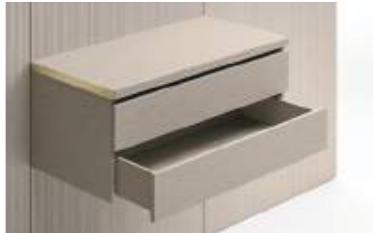
Cassetti tipo A con apertura / Type A Drawer with opening