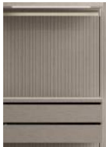
Sketch Roccia anche con schienali rigati / Sketch Roccia also with fluted back panels