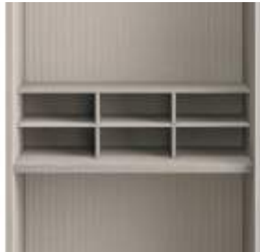
Moduli H 144 / Modules H 144