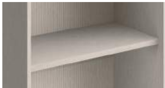
Ripiani legno P 375/510/535 / Wooden Shelves D 375/510/535