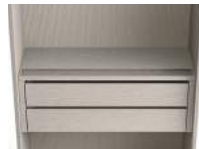
Coperchio con svuotatasche / Top with coin tray