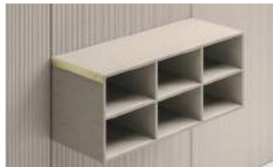
Moduli H 192 / Modules H 192