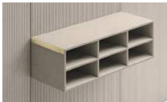
Moduli H 144 / Modules H 144