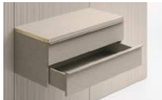
Cassetti tipo E con maniglia sporgente / Type E Drawer with protruding handle