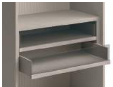
Cassetti tipo C con frontale vetro / Type C Drawer with glass front