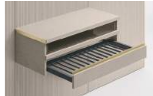
Portapantaloni / Trousers Rack