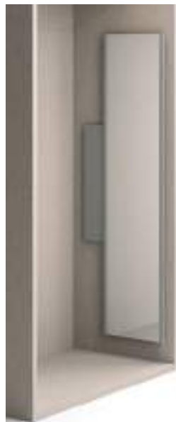
Specchio estraibile / Pull-out mirror