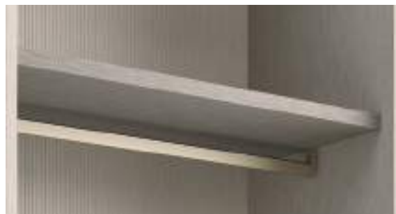
Tubo Appendiabiti / Clothes Hanging Rail