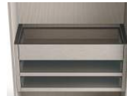
Top in vetro / Glass Top