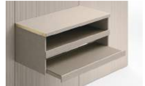
Cassetti con tappetino / Drawers with Mat