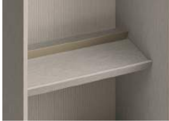
Ripiano portascarpe inclinato con battitacco – P 375 / Inclined shoe shelf with Front Trim D 375