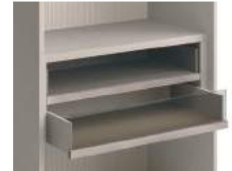
Cassetti con tappetino / Drawers with Mat