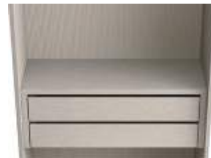
Coperchio legno / Wooden Top