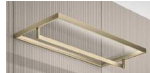
Led su ripiano a telaio con vetro / Led on frame glass shelf