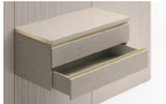
Cassetti tipo B con profilo metallo / Type B Drawer with metal profile