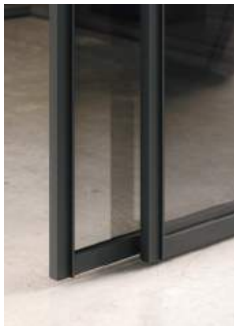
Vetro trasparente fumé