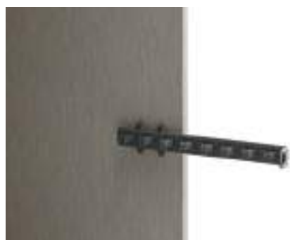
Portacinture estraibile su fianco e divisione / Pull-Out Belt Holder on side and partition