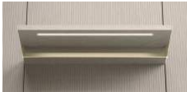
Tubo appendiabiti / Clothes hanging rail