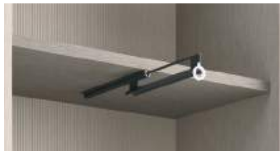
Tubo Appendiabiti estraibile – P 435 / Pull-Out Clothes Rail D 435