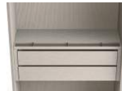
Coperchio con svuotatasche e separatore / Top with coin tray & divider