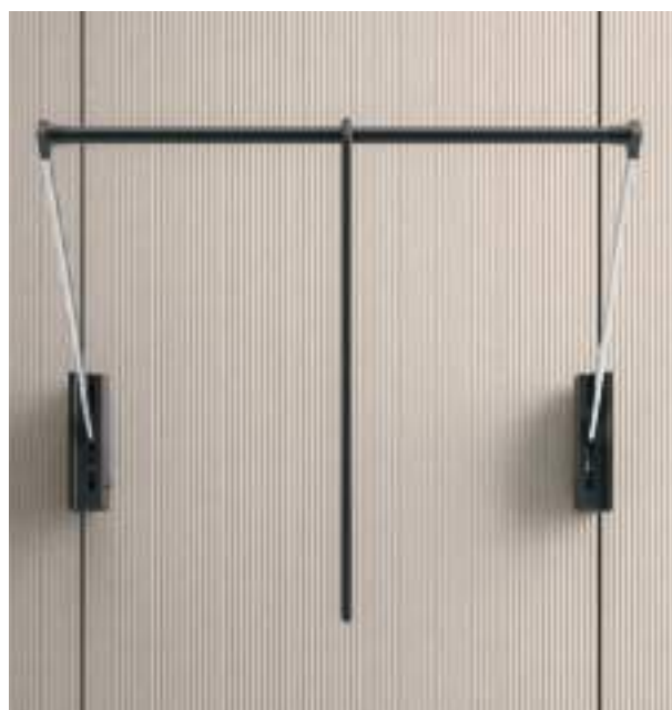
Servetto / Pull-out clothes hanging rail