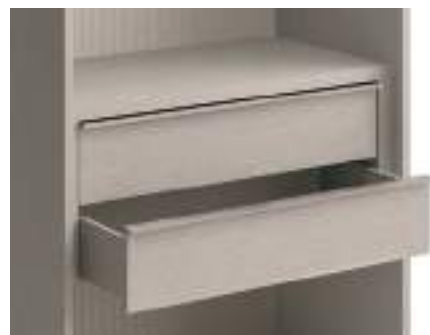
Cassetti tipo E con maniglia sporgente / Type E Drawer with protruding handle