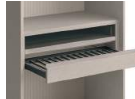
Portapantaloni / Trousers Rack